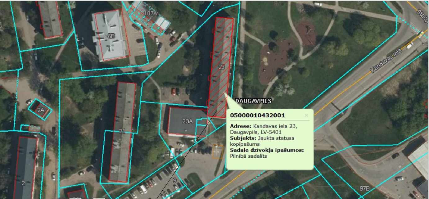
KANDAVAS IEĻA 23, DAUGAVPILS